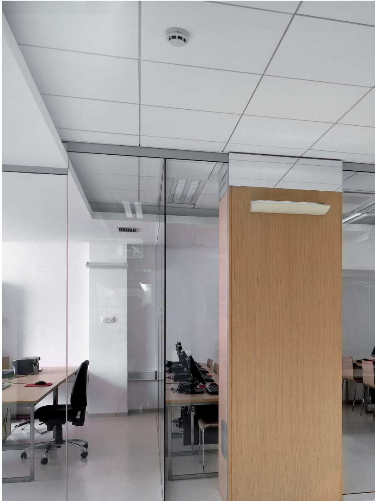
Dune Max MicroLook