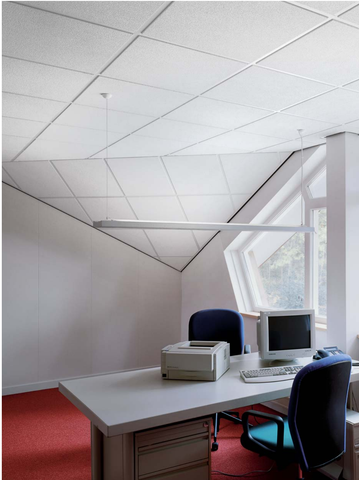
Dune dB Tegular