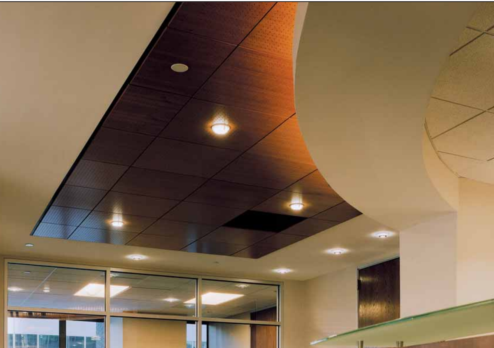
WOODWORKS Vector cerisier sur treillis PRELUDE MD de 15/16 po