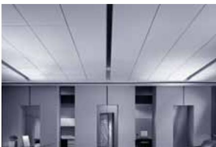
Plafond plat et de niveau avec barre en T standard