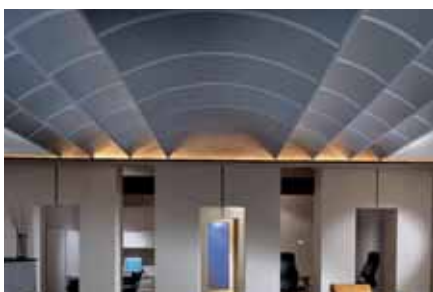
Serpentina – système de plafond « non standard »