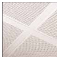
▲ Flush Tegular