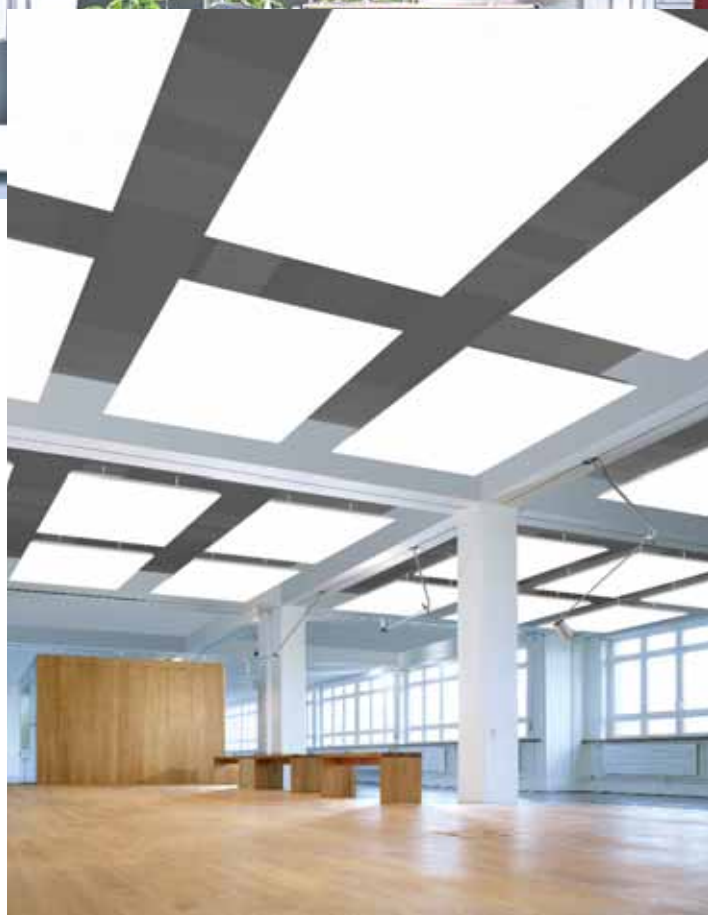
▲ Orcal Canopy vlak