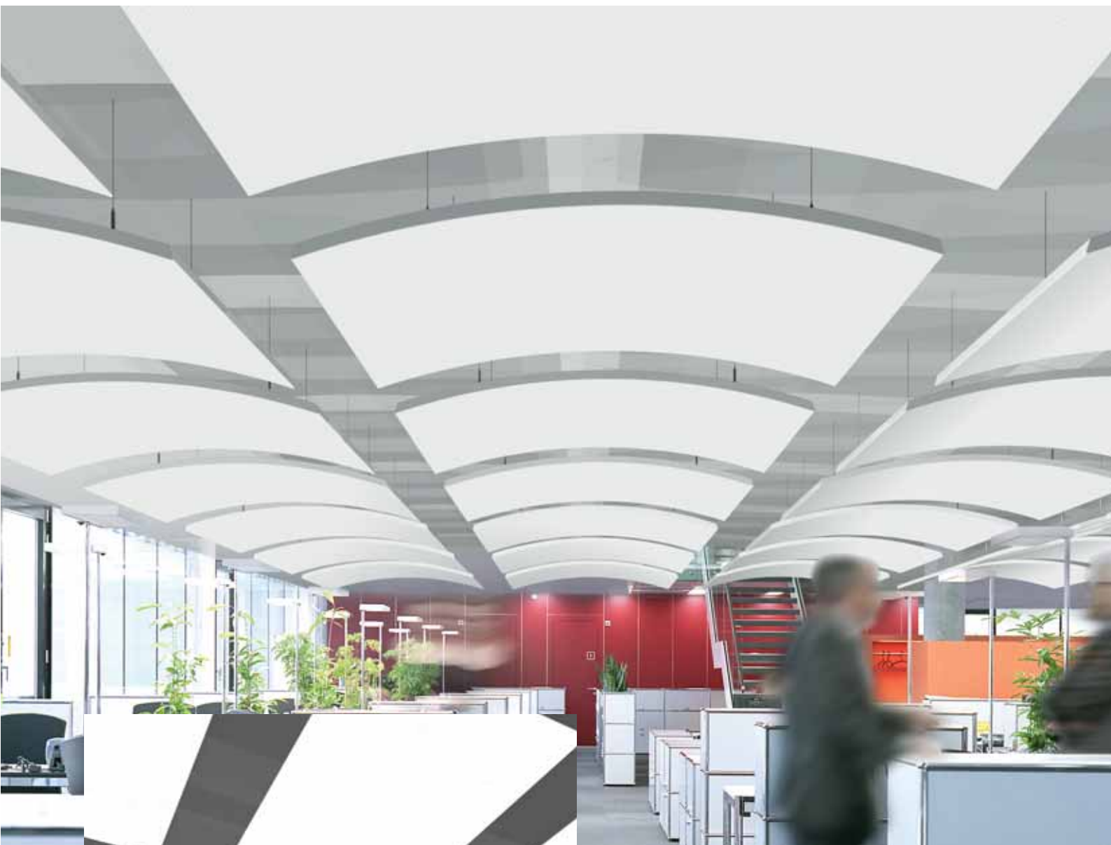
Orcal Canopy Concave ▲