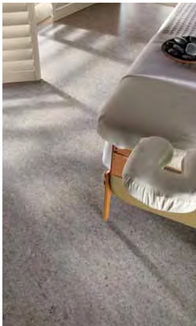
LINORETTE LP475 argent citadin