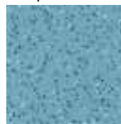
39020 bleu pâle