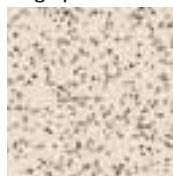
39041 beige pâle