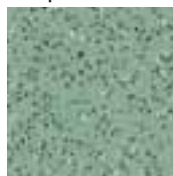
39030 vert pâle