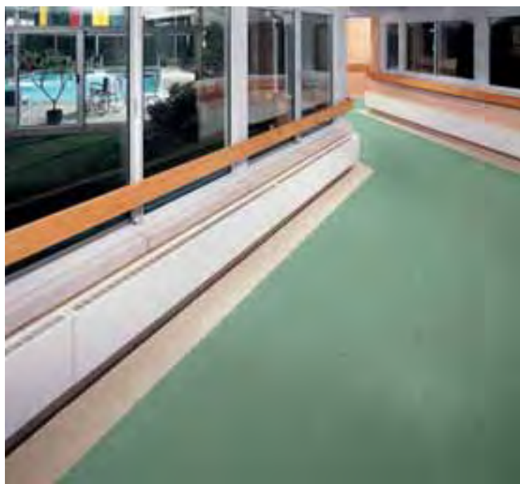
SAFEGUARD 39030 vert pâle, 39041 beige pâle