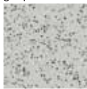
39080 gris pâle