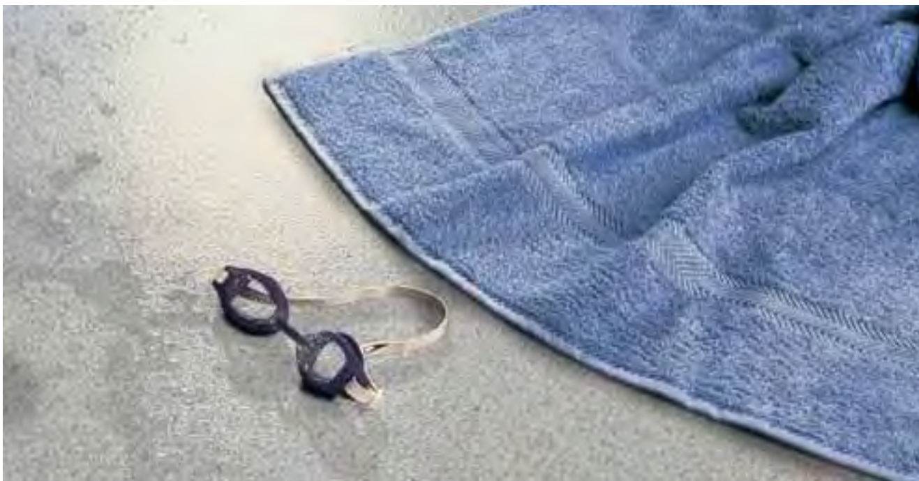
SAFEGUARD Spa 39516 gris pâle