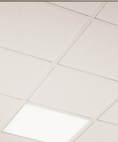
洁净室 MYLAR 配38mm洁净室龙骨